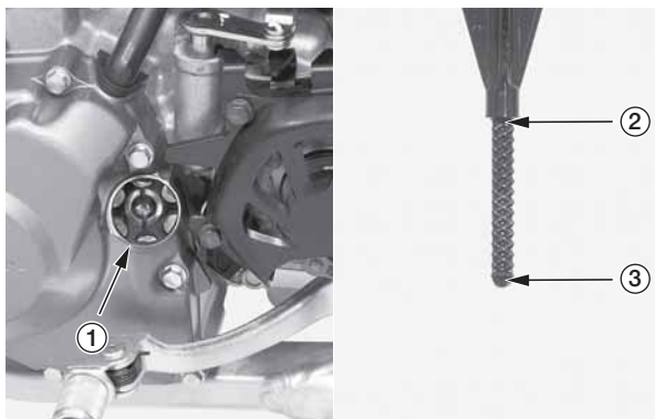
(1) крышка картера/масляный щуп (2) верхняя отметка (3) нижняя отметка