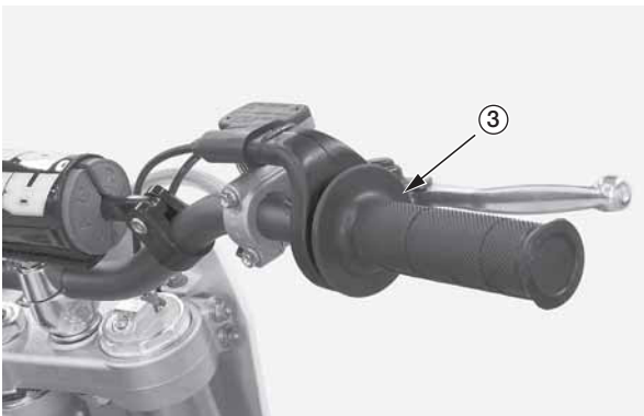
(3) рукоятка акселератора