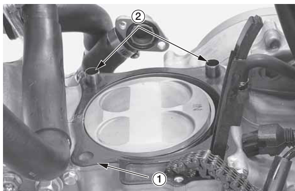
(1) прокладка цилиндра (2) установочные штифты

Будьте внимательны, чтобы установочные штифты не упали в картер.