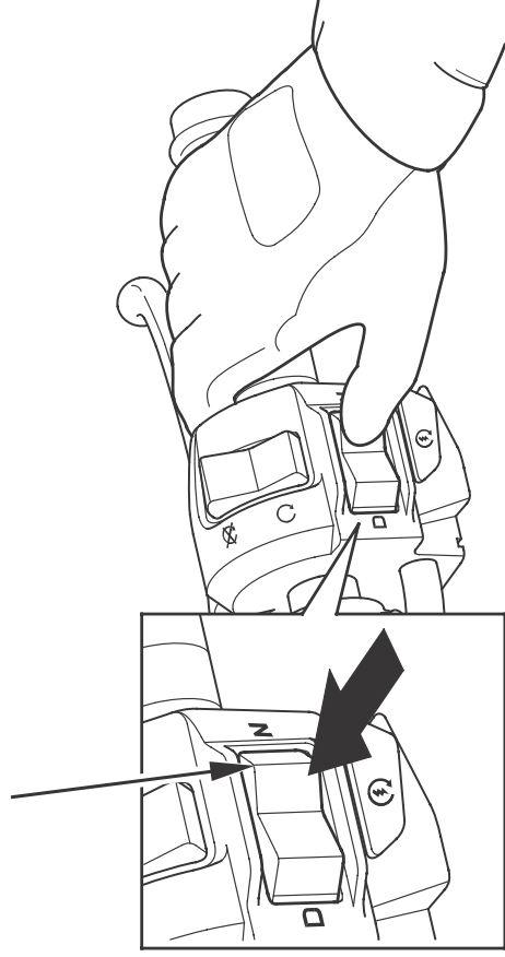
N-D切換えスイッチ(N側)

《オートマチックモードまたは6速マニュアルモードからニュートラルに切換えるとき》 オートマチックモードまたは6速マニュアルモードのときに、N-D切換えスイッチ(N側)を、ニュートラル表示灯が点灯するまで押すとニュートラルに切換わります。